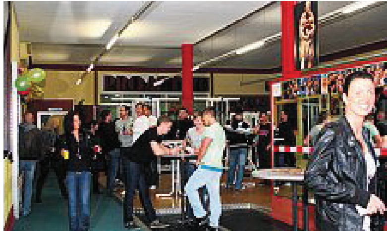
Das einjährige Bestehen des Pro-Active in Selm wurde ausgelassen gefeiert.